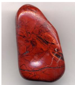
Jaspé (Image Wikipedia)

• Ap. 21:18-19 “(18) La muraille était construite en jaspé, et la Ville était d’or pur, semblable à du verre pur. (19) Les fondements de la muraille de la Ville étaient ornés de pierres précieuses de toute espèce : le premier fondement était de jaspé, ... ”